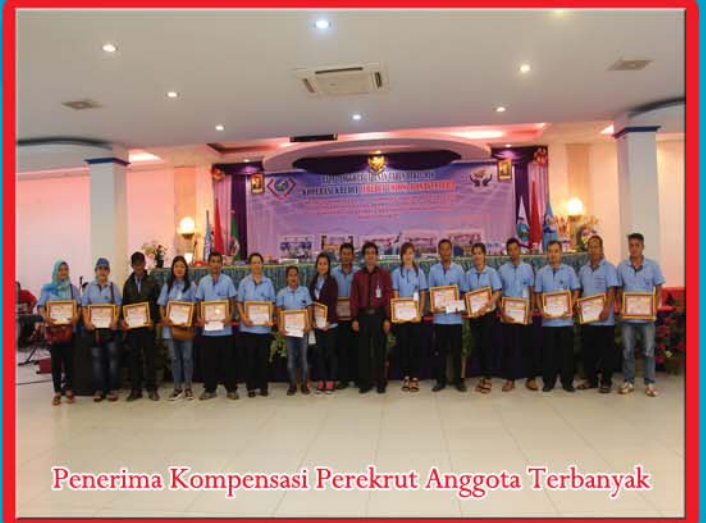
Penerima Kompensasi Perekrut Anggota Terbanyak