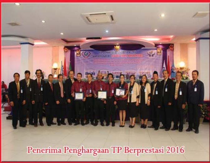
Penerima Penghargaan TP Berprestasi 2016