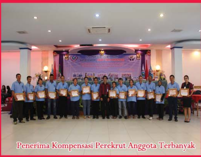
Penerima Kompensasi Perekrut Anggota Terbanyak