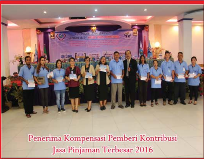
Penerima Kompensasi Pemberi Kontribusi Jasa Pinjaman Terbesar 2016