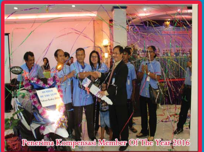
Penerima Kompensasi Member Of The Year 2016