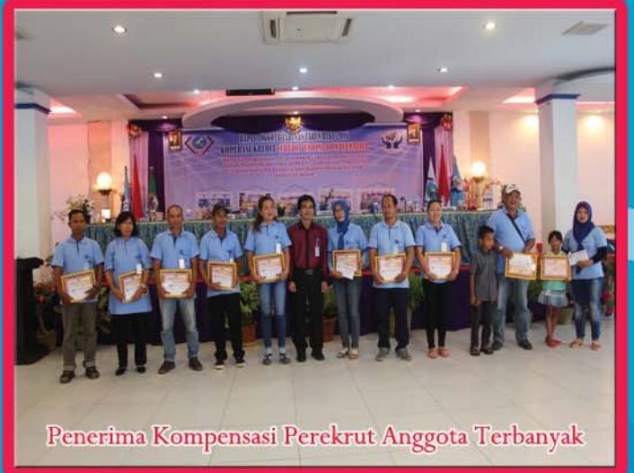
Penerima Kompensasi Perekrut Anggota Terbanyak