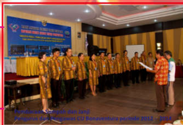
Pengucapan Salam dan Doa Pengurus dan Pengawas CU Bonaventura periode 2012 - 2014