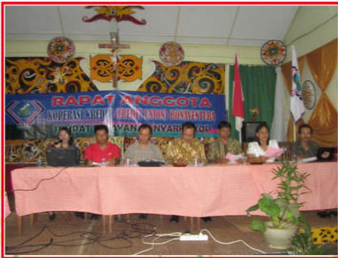
Laporan Pertanggungjawaban Manajer TP Nyarumkop.(cubv.doc)

Tempat Pelayanan (TP) Nyarumkop melaksanakan Pra RAT tanggal 22 Januari 2012 di Wisma Yafo Nyarumkop. Rapat Anggota TP Nyarumkop dihadiri 172 anggota. Dalam Laporan Pertanggungjawabannya Manajer TP menyampaikan ketercapaian Program Kerja Tahun Buku 2011 dan Program Kerja TP di Tahun 2012.