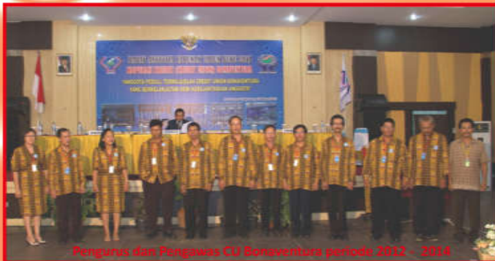
Pengurus dan Pengawas CU Bonaventura periode 2012 - 2014

Melalui Berita Acara yang dibacakan langsung oleh Ketua Pemilihan dalam Rapat Anggota Tahunan (RAT) CU Bonaventura Tahun Buku 2011, berdasarkan hasil Pemilihan di sepuluh Tempat Pelayanan Koperasi Kredit (Credit Union) Bonaventura, total anggota yang diundang 2515 orang, hadir 1399 orang (55,63% dari undangan), menggunakan hak pilih 1356 orang.